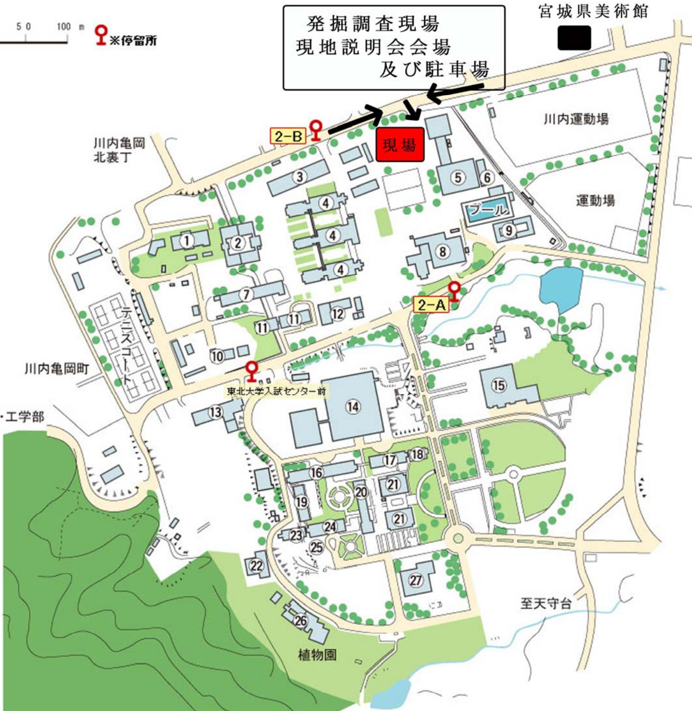
東北大学川内キャンパス