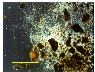
水中で崩壊する土の粒

微生物のすみ家を尋ね、土の粒を奥へ奥へと探る(右下)。見慣れた姿の細菌とともに、シリカ微粒子に包まれた無数の鉱物化細菌に出会う。背後には、何万年何億年にわたる細菌と鉱物との交わりが見え隠れする。土誕生の新しい一章が浮かんでくる。