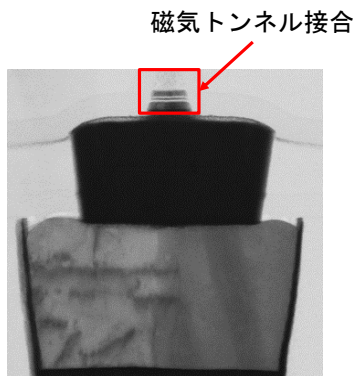
図1 本研究で開発したプロセスインテグレーション技術を用いて作製した磁気トンネル接合の断面図。