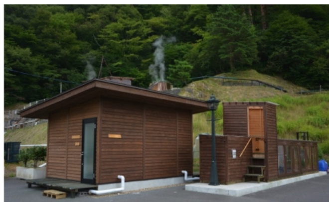
(エネカフェメタン外観)