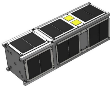
図1 超小型人工衛星「HOKUSHIN-1」 太陽電池パネル 展開前