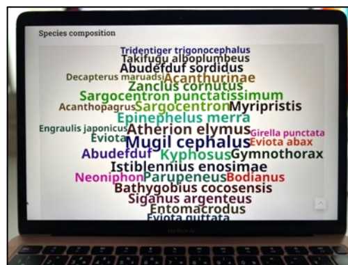
＜環境 DNA 分析結果 閲覧画面＞ DNA が検出された魚種（学名）が表示 検出量に応じた大きさで表示される仕様

環境 DNA 調査データを蓄積した専用データベースの構築、およびオープンデータとして一般公開されることは世界初となります。