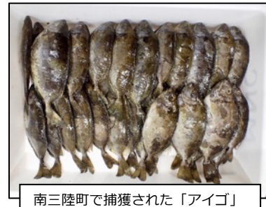
南三陸町で捕獲された「アイゴ」

南三陸町では、回遊変化等の現状把握と対策検討において「ANEMONE DB」を活用していく方針です。また、日本全国の環境 DNA データベースが、地域の漁業現場でも有効に活用されていくと考えていることから、率先して利活用を推進しています。