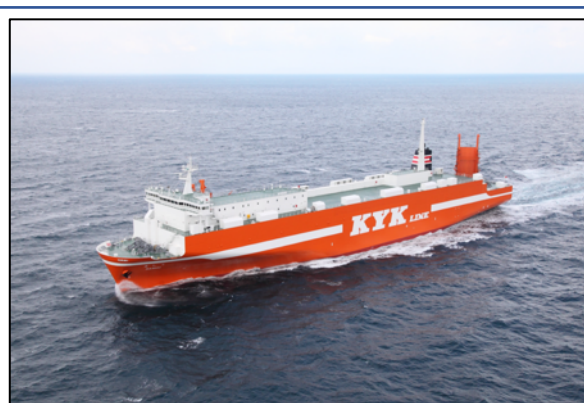
海水サンプリングを行う近海郵船の運航船「ましろ」