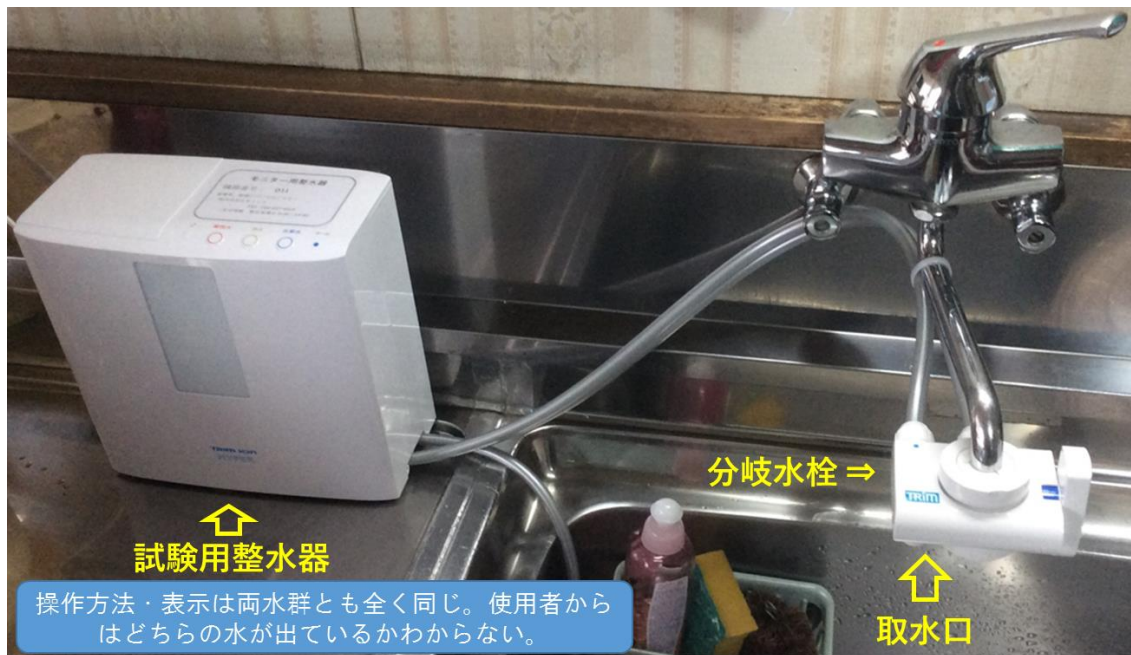
図 1. 試験用整水器の設置例

蛇口を開くと、水道水は蛇口に設置された分岐水栓から整水器に流れ込み、内蔵の活性炭フィルターにより浄水となり、さらに電解槽により電気分解されアルカリ性で水素 ( \text{H}_2 ) を含む電解水素水になり、分岐水栓の取水口から生成される。