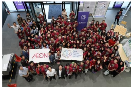
東北大学災害科学国際研究所にて

ASEP は、2012年から毎年実施しており、アジア各国の大学生が集い、各国の自然環境や価値観の違いを学びながら、地球環境問題について討議を行う取り組みです。第6回の2017年は日本で開催され、8カ国8大学64名の大学生が「生物多様性と再生」というテーマのもと、東北の被災地を中心にフィールドワークを行いました。その中で亶理町で震災を経験した高校生・大学生とともに植樹を行うとともに、東北大学災害科学国際研究所において史料保全修復体験と減災について学びました。