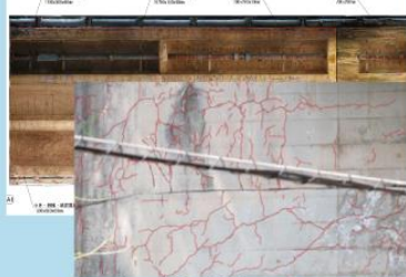
AIがひび割れ抽出したトレース写真