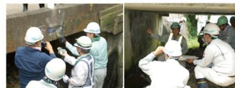
登米市での実証 (2018年7月10日)

時間短縮・コスト削減を望めるシーズの試行や、専門家による点検・補修のアドバイスを実施。