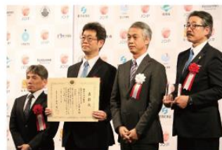
第1回日本オープンイノベーション大賞授賞式 (2019年3月5日)