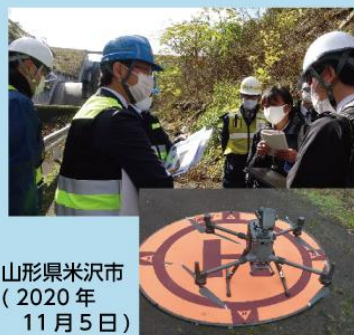
山形県米沢市 (2020年11月5日)