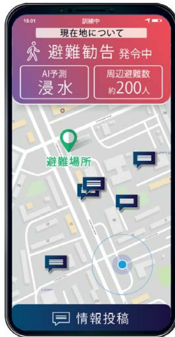
図2: 津波避難を後押しするスマホアプリ画面のイメージ図