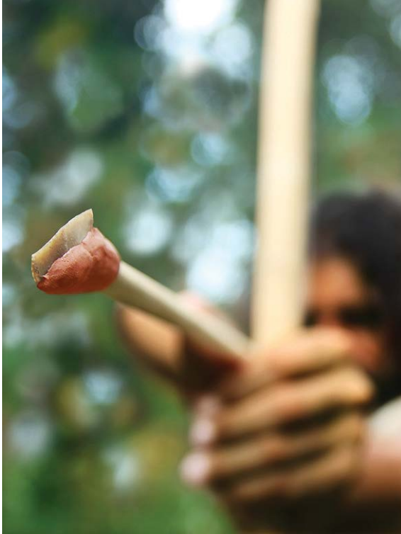
写真1: 現生人類が三日月形石器を矢に付けて弓で投射するイメージ写真

本研究成果は、2019年9月26日(英国時間)に Nature Ecology & Evolution 誌にオンライン掲載されました。