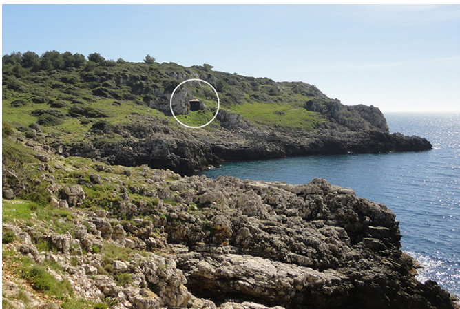
写真3:カヴァロ洞窟の遠景