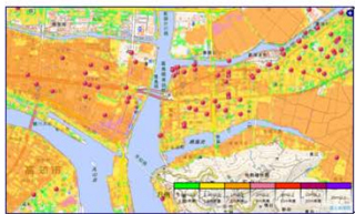
浸水予測地図の表示例（赤いピンは避難ビル）