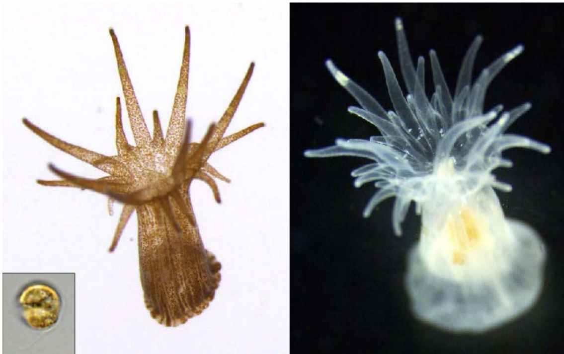
図 1. モデル刺胞動物のセイタカイソギンチャク。褐虫藻(左下枠内)を共生させた状態(左)とさせない状態(右)を実験室内で誘導できる。